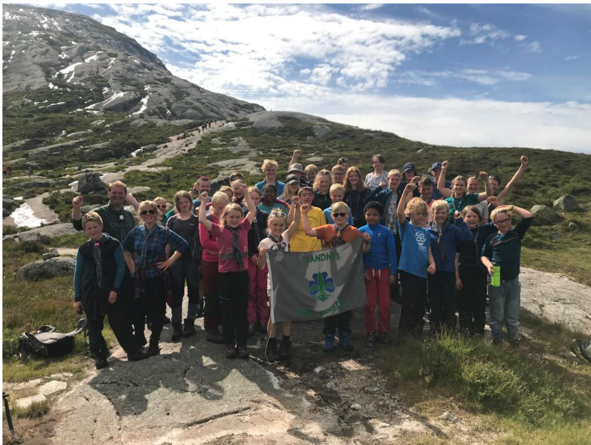
Tur til Kjerag, Sommerfjelleir Ådneram 2020